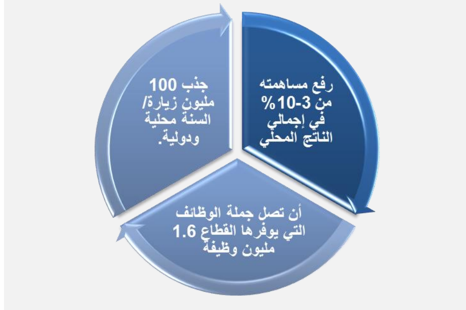
الشكل ٢: استراتيجية قطاع السياحة حتى ٢٠٣٠م

يتم تنفيذ تلك الاستراتيجيات من خلال ثلاث جهات رسمية ورئيسية في المملكة العربية السعودية؛ هي: