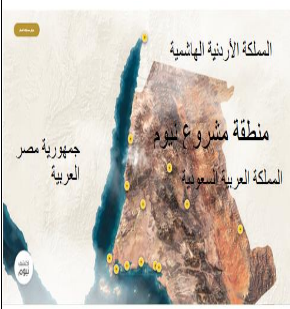
شكل ٦: موقع مشروع نيوم.

المصدر: صندوق الاستثمارات العامة، الموقع الإلكتروني لمشروع نيوم