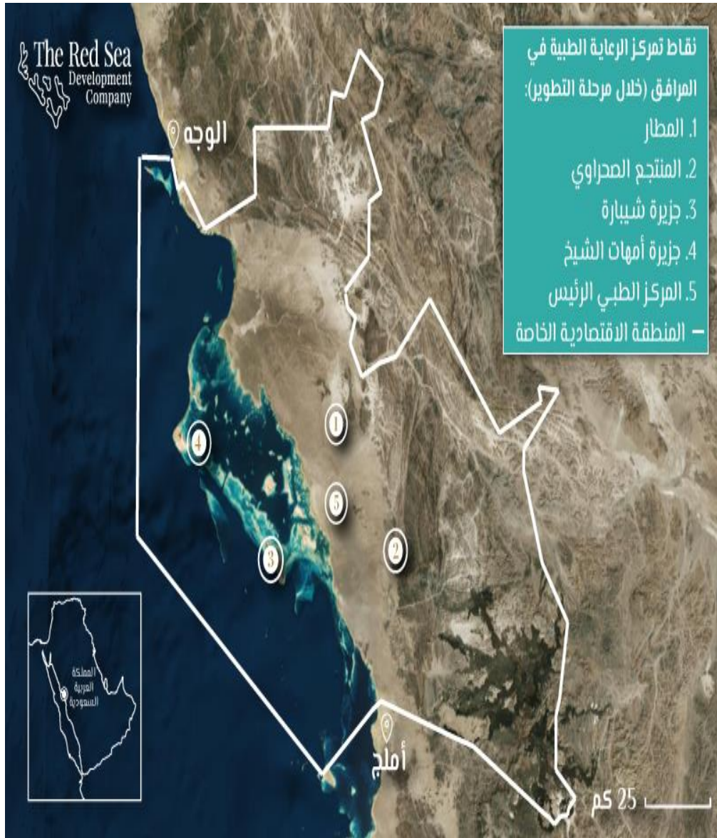
شكل ٥: مشروع البحر الأحمر السياحة الفخمة