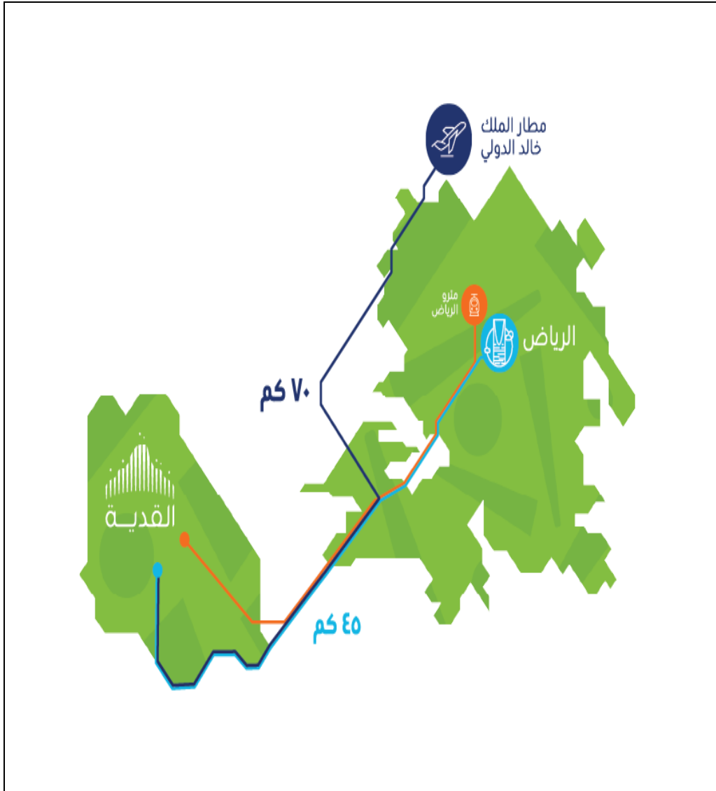
شكل ٧: مخطط موقع مشروع القديية بالنسبة لمدينة الرياض.